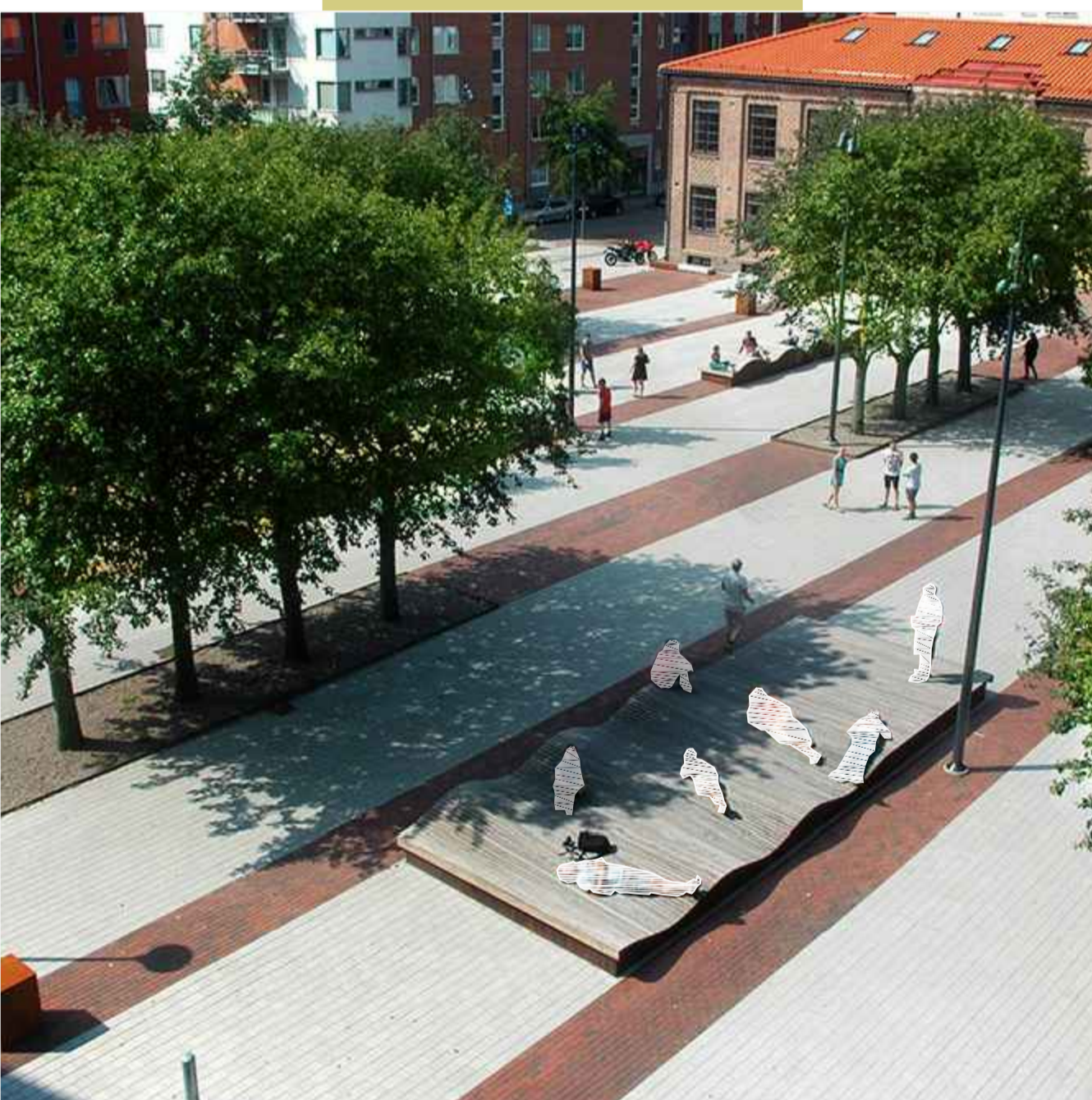
Bildquelle: Solid Surf Isles von STREETLIFE