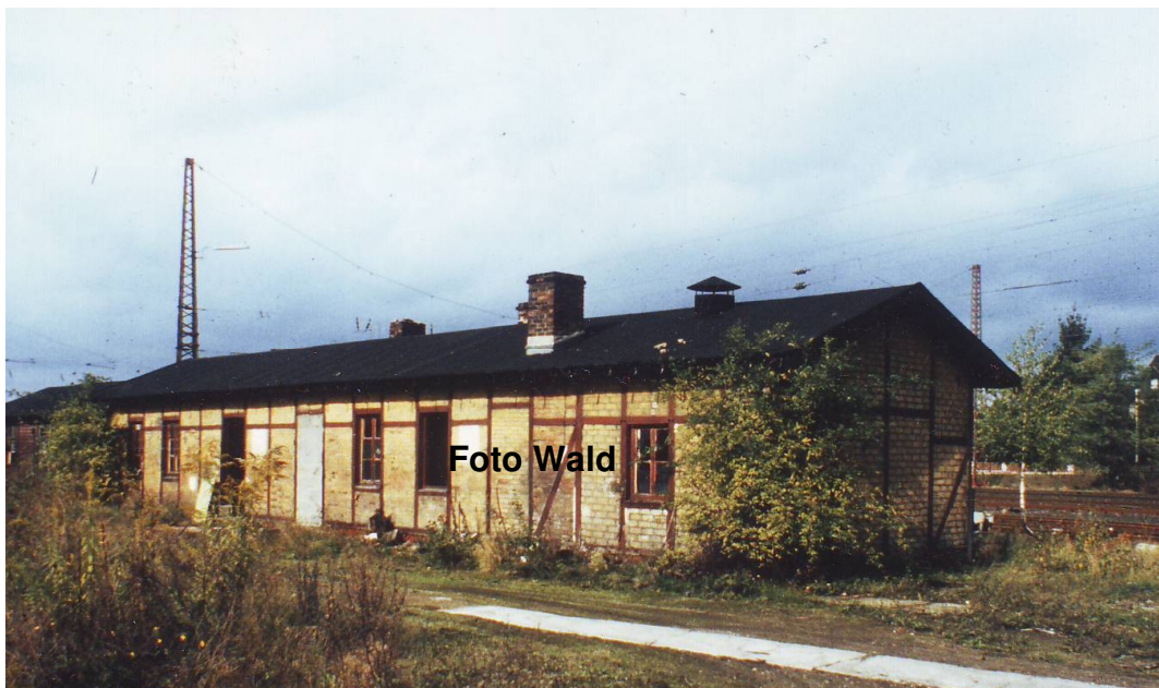
Schlosserei und Schreinerei (links) des ehemaligen Bw Engers