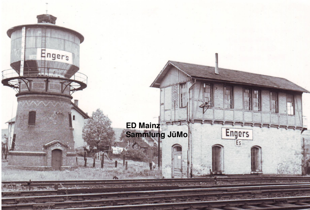
Stellwerk Engers-Süd 1951